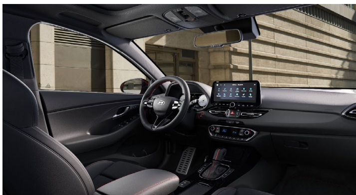
Černý interiér N line – látkové čalounění s červeným prošíváním a logem N – černé čalounění stropu a obložení bočních sloupků – červeně prošívání sportovní volant, hlavice řadič páky a loketní opěrka