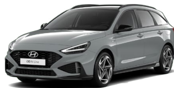
Shadow Gray Pastelová Cena: 16 900 Kč Dostupná pouze pro výbavy N Line