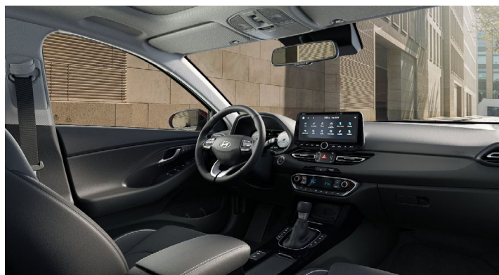
Černý interiér Oceanic Black Premium – kožené čalounění sedadel – černé čalounění stropu a obložení bočních sloupků – světlé čalounění stropu a obložení bočních sloupků – černé provedení přístrojové desky a výplní dveří