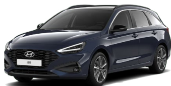
Sailing Blue Pearl Perleťová Cena: 16 900 Kč