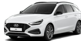
Serenity White Pearl Perleťová Cena: 16 900 Kč