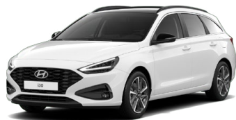
Atlas White Pastelová Cena: 5 900 Kč