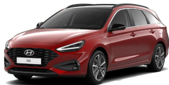
Ultimate Red Metallic Metalická Cena: 16 900 Kč