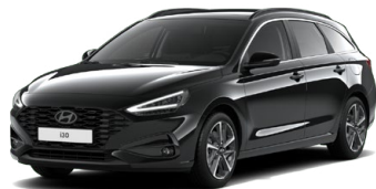
Abyss Black Pearl Perleťová Cena: 16 900 Kč