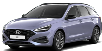
Meta Blue Pearl Perleťová Cena: 16 900 Kč