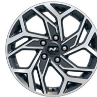
17" kola z lehké slitiny – N Line