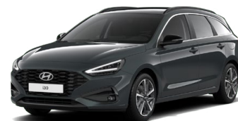
Cypress Green Pearl Perleťová Cena: 16 900 Kč