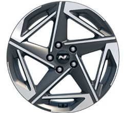
18" kola z lehké slitiny – N Line

* K dispozici pro vozy vyrobené do 9/2024.