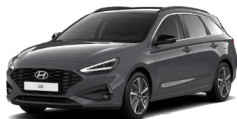
Ecotronic Gray Pearl Perleťová Cena: 16 900 Kč