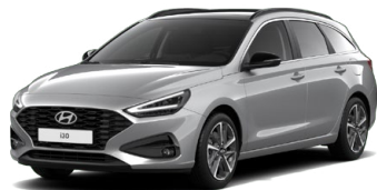
Shimmering Silver Metallic Metalická Cena: 16 900 Kč