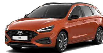
Jupiter Orange Metallic Metalická Cena: 16 900 Kč