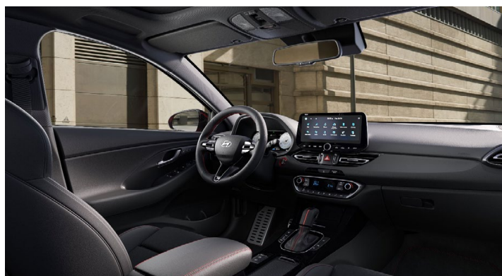
Černý interiér N line Premium – prémiové čalounění v kombinaci kůže/semiš – černé čalounění stropu a obložení bočních sloupků – červeně prošívání sportovní volant, hlavice řadič páky a loketní opěrka