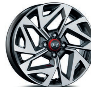
16" kola z lehké slitiny

12 Záruka 12 let na prorezivěnou karosérii.